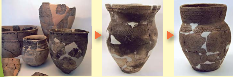
オホーツク式土器 (右側ほど、年代が新しくなる)

利尻島には、いつから人が住んでいたんだらう。どんな人が、何をして食べていたんだらう。ひつぱちゃんと一緒に古代にタイムスリッパして、利尻の「遺跡」を勉強してみようよ。