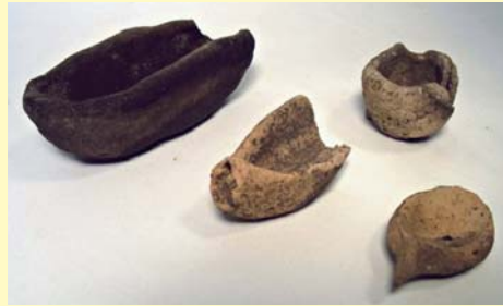
舟の土製模型 (ミニチュア)