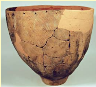
すすやしき 鈴谷式土器