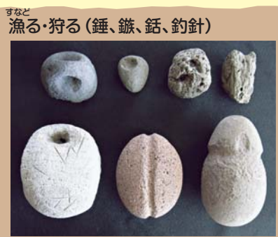
すなど 漁る・狩る (銚、鎌、銚、釣り針)