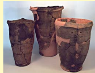
縄文土器 (港町1遺跡)