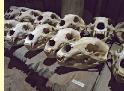
復元された骨塚 (オホーツクミュージアムえさし)