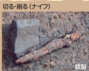
切る・削る (ナイフ)