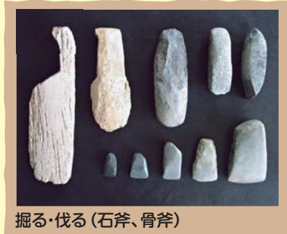
掘る・伐る (石斧、骨斧)