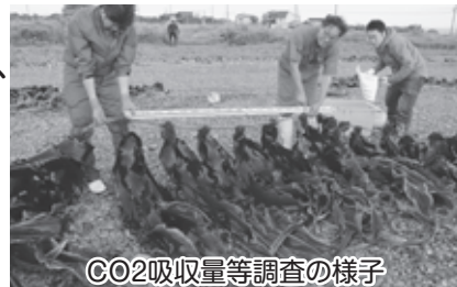
CO2吸収量等調査の様子

気候変動による海の環境変化が叫ばれる昨今ですが、現在利尻富士町ではリシリコンブのCO2吸収量等を調査し、持続可能な漁業の推進のため気候変動対策にも取り組んでいます。