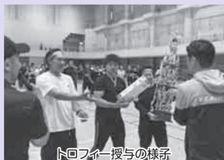
トロフィー授与の様子

今回の大会で終了せず第2回以降も実施する予定とのことで、利尻島の新たなイベントとして盛り上がり期待しています。