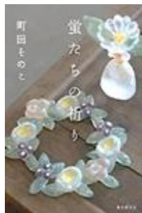
蛍たちの祈り 町田そのこ