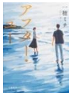
アフター・ユー 一穂ミチ